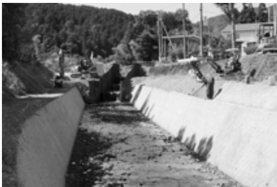
災害に強い川に改修（片山地内）