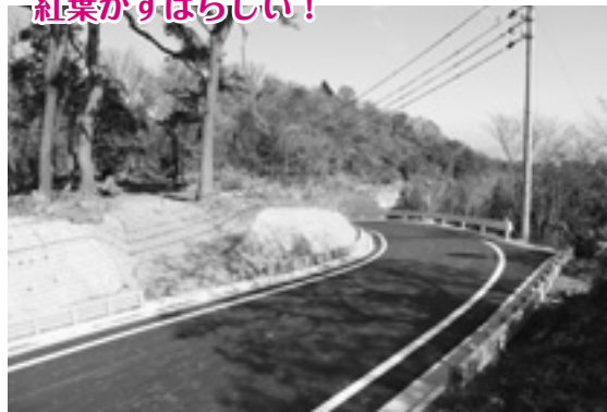
県単林道事業費（H26年度 18,684千円） 20年かけて延長6,310m完成した。