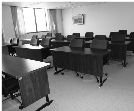
庁舎玄関付近・3階内部床、壁の改修