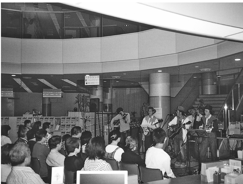
池田町図書館でのコンサートの様子

〈※〉ブラッシュアップ支援事業とは「じまんの原石」池田山を観光資源として強化・再生をするため、願成寺西墳之越古墳群周辺及び登山道の整備をおこなう事業。