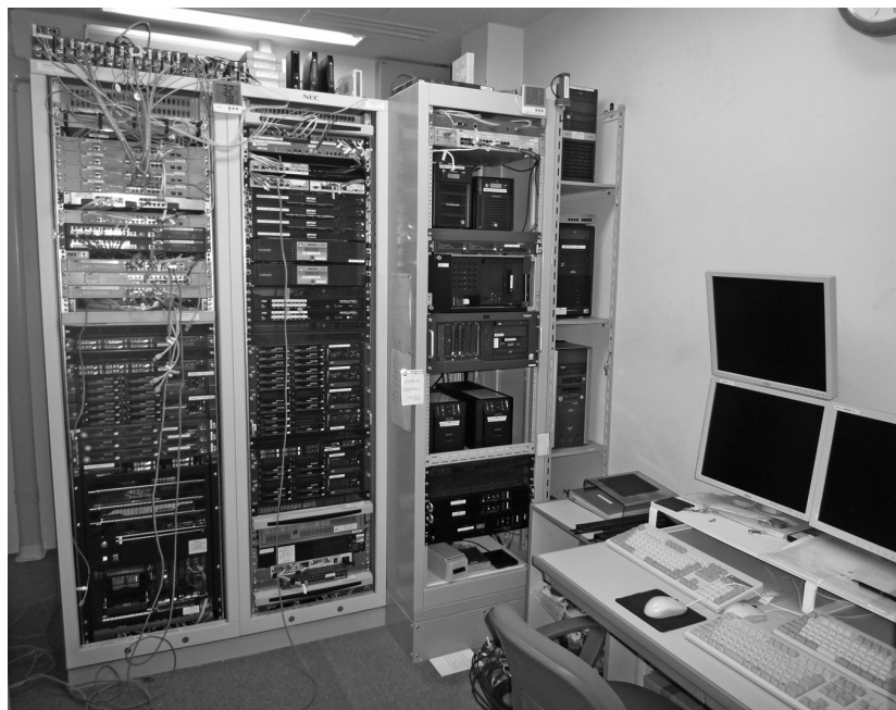
大量のデータが保存されているサーバー (池田町役場情報政策室)

答 町としては節電に努め、 *デマンド契約しているが、 農業集落排水施設につい ては、今後とも安価にな るよう検討していく。