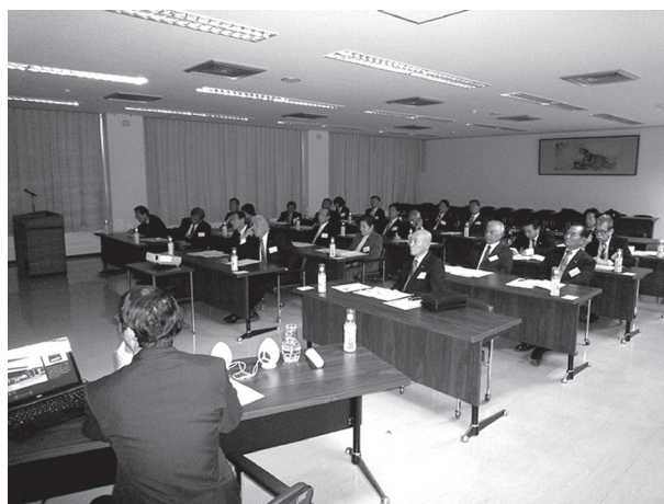
池田町役場協議会室にて、スライドを交えての説明

神戸町・池田町管内における火災や救急・救助についての状況、更には今後発生が予想される巨大地震に対する備えなどについてお話を聞き、私達の日常生活をサポートして頂いていることを改めて実感しました。今後とも安全で安心なまちであり続けることが出来るよう期待するものです。