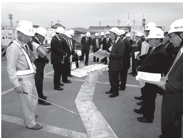
東海環状自動車道の流れの説明を聞く

平成25年11月6日 東海環状自動車道（西回り）の事業進捗状況について、仮称大野・神戸IC～大垣西IC区間の視察研修会が開催され、国土交通省 岐阜国道事務所の説明を聞きました。着々と工事が進捗しており、完成が待たれますが、全線開通後には人と物の流れが大きく変わり、この地域の活性化が期待されます。