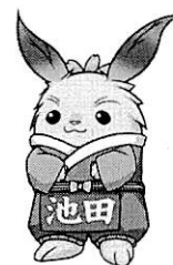
池田町マスコットキャラクター ちゃちゃまる