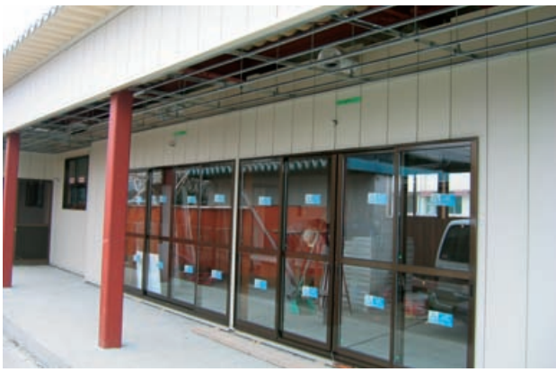
3月完成予定の八幡児童館・児童クラブ室

池田町では、年2回(2月・8月)予算などの財政状況を公表しています。これは皆さんが納めた税金や地方交付税、国や県からの補助金等の大切なお金がどのように使われているか、また借入金はいくらあるかなどをお知らせし、町民のみならずにご理解いただくこととするものです。 今回は、平成19年4月から平成19年9月末日までの上半期分を紹介します。