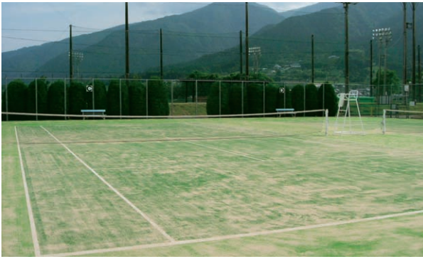
新しい人工芝に張り替わった池田公園テニスコート