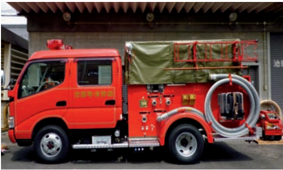
消防ポンプ自動車整備事業・小型動力ポンプ整備事業

池田町では、年2回(8月・2月)、予算などの財政状況を公表しています。これは皆さんが納めた税金や地方交付税、国や県からの補助金などの大切なお金がどのように使われているか、また借入金はいくらあるかなどをお知らせし、町民の皆さんにご理解いただくこととするものです。 今回は平成21年4月から平成21年9月末日までの上半期分を紹介いたします。