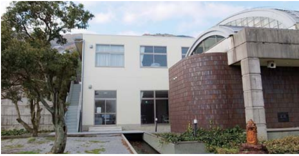
平成24年8月に増築した総合体育館トレーニング室

池田町では、年2回（8月・2月）、予算などの財政状況を公表しています。これは皆さんが納めた税金や地方交付税、国や県からの補助金などの大切なお金がどのように使われているか、また借入金はいくらあるかなどをお知らせし、町民の皆さんにご理解いただくこととするものです。 今回は平成24年4月から平成24年9月末日までの上半期分を紹介いたします。