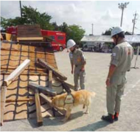
平成25年8月に実施した揖斐郡総合防災訓練の様子

事業」、「障がい者福祉・自立支援給付事業」、「高校生までの医療費支援事業」、「児童手当」といった事業費の大きいものは順調に進捗しております。