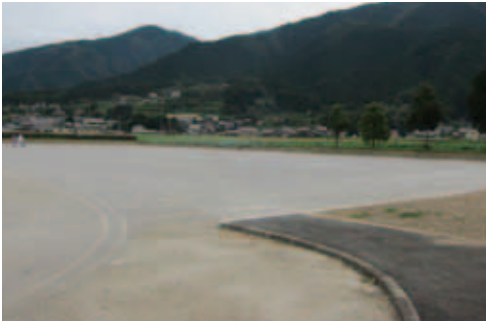
平成26年8月に整備が完了した池田公園多目的広場です。