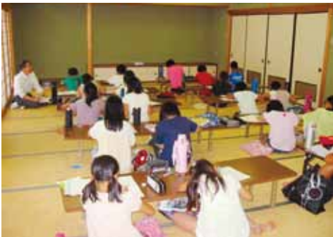
▲学習に励む児童生徒たち