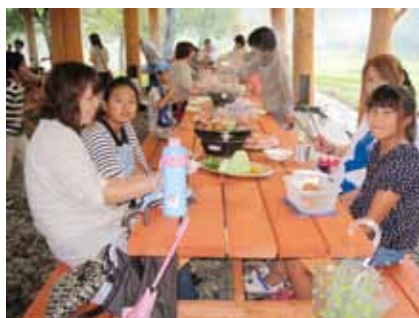
▲「おいしく焼けたかな？」