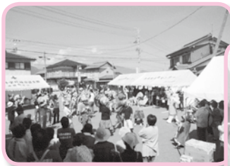
昨年度のげんき祭の様子