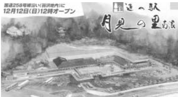
1年前にできた国道258号沿いの道の駅 総事業費 14.5億円、 町負担9.5億円(借金6億円) ※用地費は借地料のみ