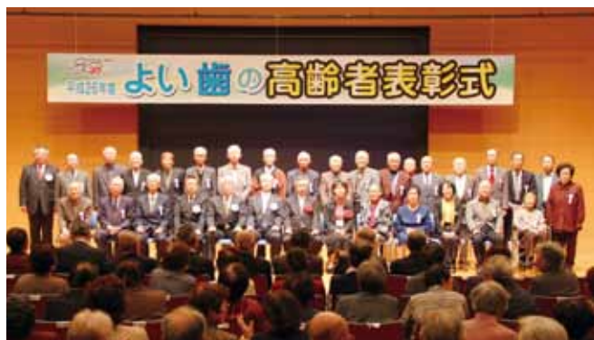
▲表彰おめでとうございます