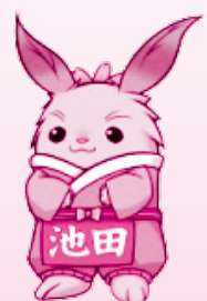
池田町マスコットキャラクター ちやちやまる

池田町教育委員会 社会教育課(中央公民館内) ☎ 0585・45・3111(内線177) FAX 0585・45・7116