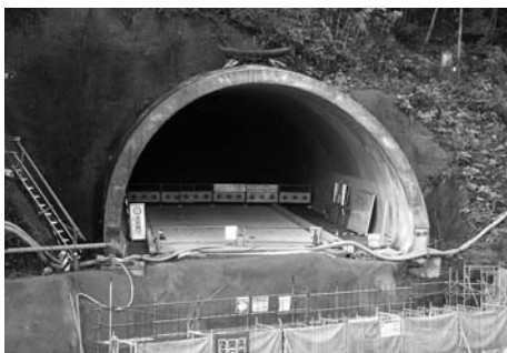
(仮称) 梅谷トンネル。車道の舗装も終了