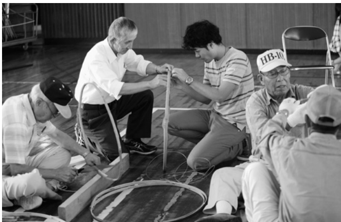
▲世代を超えた協力作業の様子