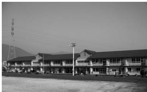
改築された温知小学校 平成19年3月完成