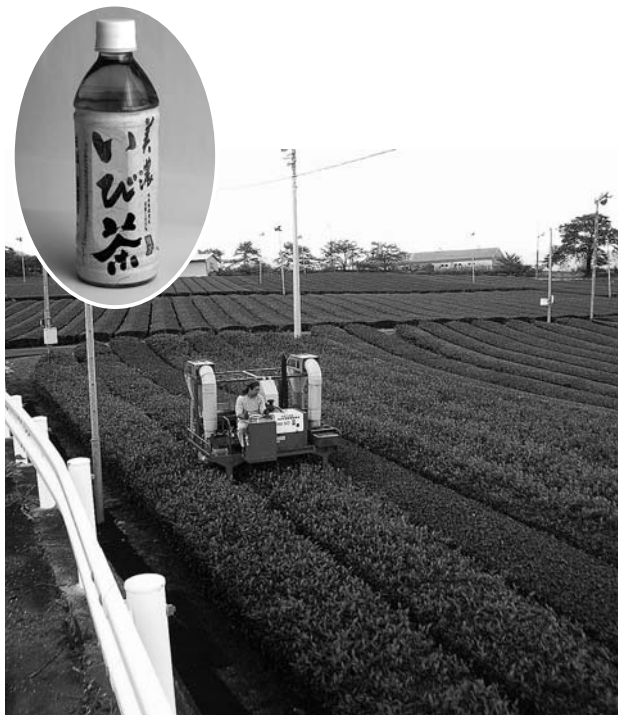
乗用型茶刈機による収穫(願成寺地内)と『美濃いび茶』