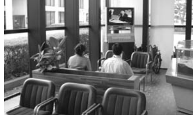
庁舎ロビーで議会中継がご覧頂けます。