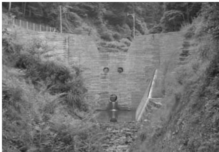
砂防ダム (H.18.3完成 池田温泉西)