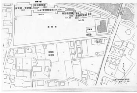
八幡小校舎レイアウト及びIs値