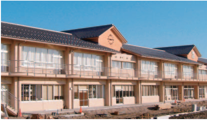
全面完成が待たれる温知小学校新校舎

池田町では、年2回(8月・2月)予算などの財政状況を公表しています。これは皆さんが納めた税金や地方交付税、国や県からの補助金等の大切なお金がどのように使われているか、また借入金はいくらあるかなどをお知らせし、町民のみならずにご理解いただくこととするものです。 今回は平成18年4月から平成18年9月末日までの上半期分を紹介します。