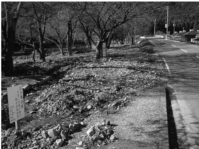
大津谷公園の土砂流出現場