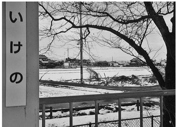
池野駅北側の農地

池野駅北側の開発計画は過去にもあり、農地の土地利用計画を立て医療関係の集中も出来る。又町の開発公社所有地に誘致する事も考え、土地は提供する部分が多くある。今後情報を収集しながら企業誘致の一環として考え、土地を提供してでも開業医の誘致について粘り強くやっていく。