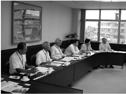
内灘町議会での研修の様様