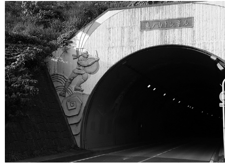
トンネルは広告塔（東ノ山トンネル・桂側より）

開通時期はまだ決定していないが22年の5月の連休前なので、温泉を中心に交流イベントを開催したい。温泉も開通記念行事を3月から予定している。両町で計画を練っていききたい。