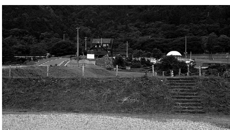
のりめん法面を花飾りで集客を（霞間ヶ溪公園駐車場）