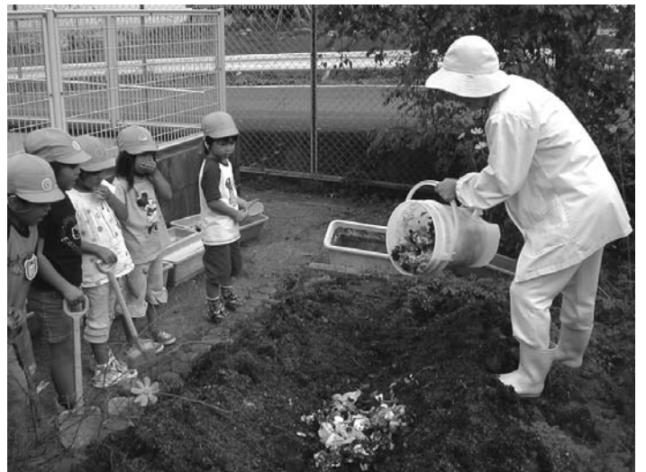
ボカシによる土づくり