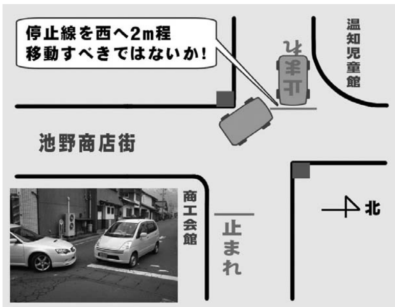
温知小付近交差点

町長 以前は西に下がっていたが、見通しの問題で前に出した。地元や公安委員会とも十分協議していく。