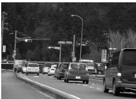
岐阜関ヶ原線と西幹線の交差点

自主運行バスが10月より月曜日に試行運転されているが祭日の月曜日には運休になることがある。更なる運行本数の充実と日数の拡充を求める。