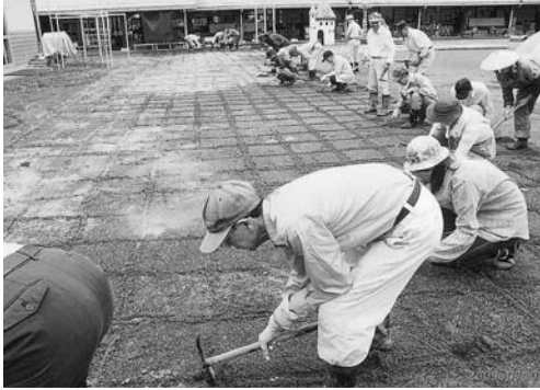
地域の人による植穴掘り