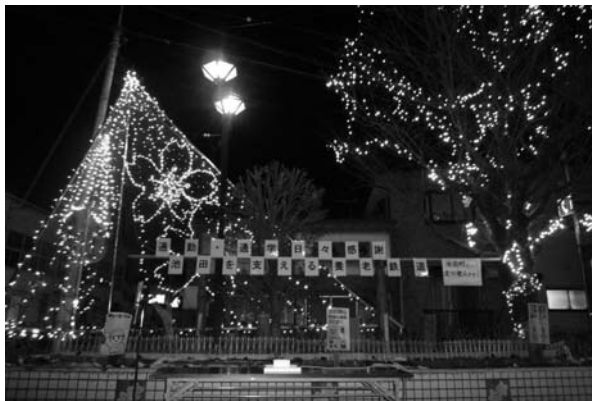
皆様のご協力によりイルミネーション点灯（北池野駅）

長年、地域経済の発展に貢献し通勤通学の足として利用されてきた近鉄養老線は、年々右肩下りの厳しい経営状況となりました。そこで平成16年春から地元自治体（3市4町）と近畿日本鉄道（株）は養老線の存続のための協議を重ね、平成19年10月より新会社養老鉄道として各市町が支援することによりスタートし、早くも3年目を迎え本年10月が再契約の年となりました。再契約には地元自治体の合意が必要となりますが、各自治体にとって負担金は大きな額ではありませんので、少しでも負担額が減少し、スムーズに再契約が出来ますよう、今後も住民の方々の支援をお願いすると共に鉄道の存続の重要性をより意識し、維持発展に向け地域全体が協力し続けることが必要ではないでしょうか。