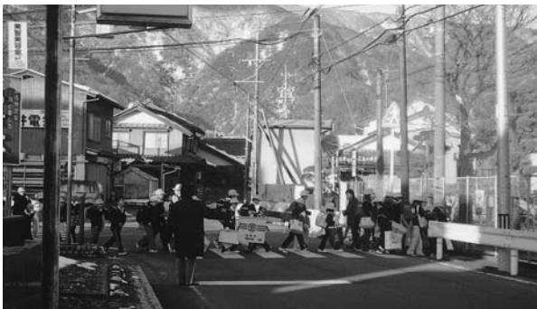
温知小南の横断歩道

農協側と協議も進み用地関係は了解を得ている。安全に2列通行ができる幅を計画し、測量も終わって計画法線まで入れている。22年度農協側を細かい部分について、協議を進めていきたい。横断歩道を渡り真すぐ校庭に入ることについて、構内通路のことも考え学校側と協議を進めていく。