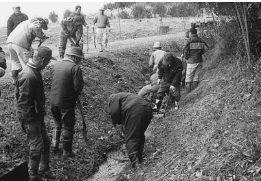
地域に定着しつつある農地・水環境保全対策事業