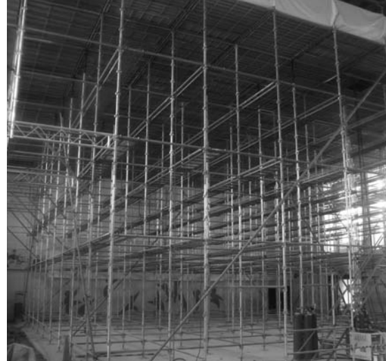
池田小の耐震補強工事