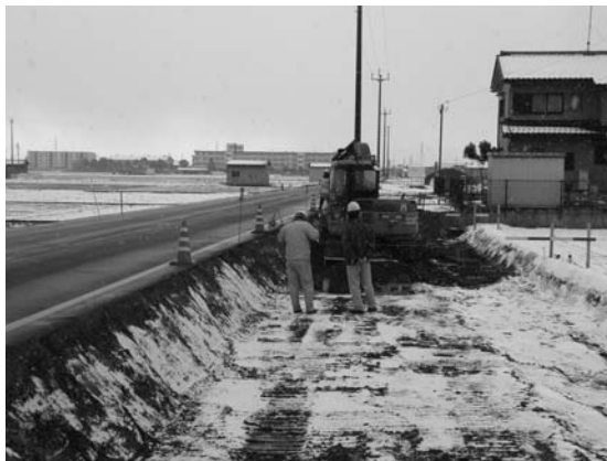
東幹線の拡幅工事（ガソリンスタンド～池田高校）