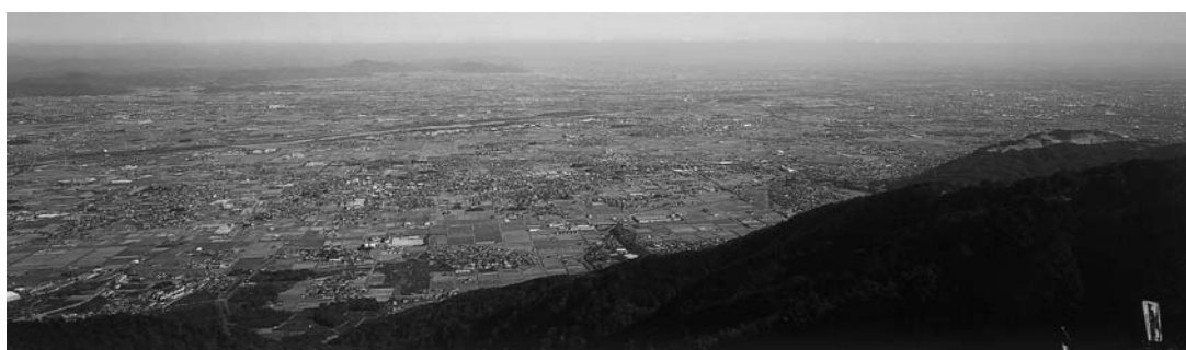
池田山頂からの雄大な眺望

岐阜県の財政は大ピンチで、この4年間を緊急財政再建期間とし、初めて職員給与を削減し、再来年から2〜3年は新規採用なしだ。当町への県補助金は年間4〜5億円あるが今後の影響は。