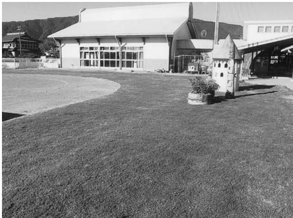
3ヶ月で見事な芝生に

教育現場においても、芝生化が新聞・テレビなどで取り上げられる様になった。芝生化の効果として健康面・教育面・環境面でもさまざまな効果が期待できる。 養基保育園で、保護者、園児、地域の皆さんの協力で園庭周辺700㎡の芝生化を実施した。費用は、㎡当り163円と非常に安価で出来た。今後他の保育園でも実施する計画はあるか。