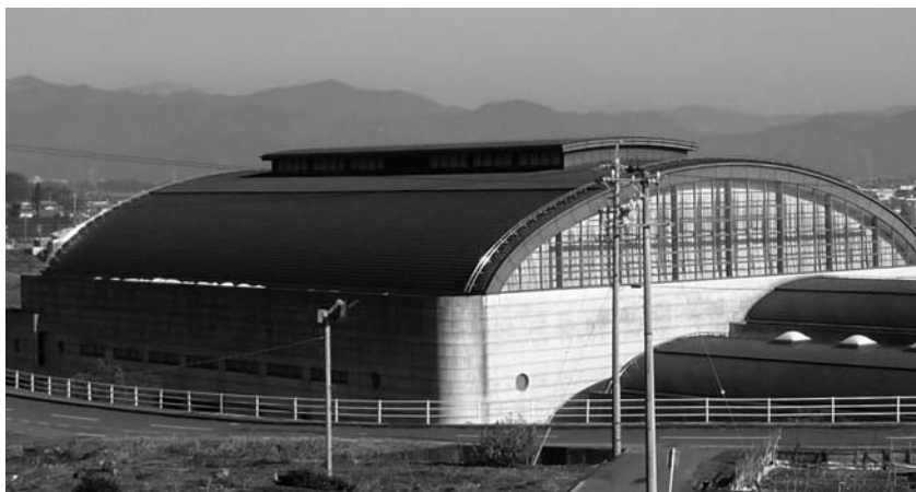
遮熱塗装で館内温5℃位低下（総合体育館）