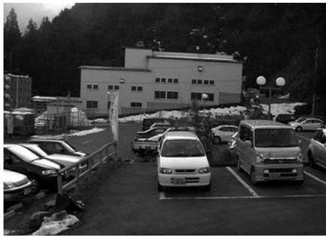
池田温泉本館駐車場とクリーンセンター

主要地方道岐阜関ヶ原線の梅谷片山トンネルの開通が22年4月末に迫っており、交通量の大幅な増加が見込まれる。池田温泉の利用者増も見込まれるが一年後に整備される道の駅の駐車場から高齢者が本館を利用するのは大変。クリーンセンターを早急に解体し池田温泉本館の駐車場の拡張を。また、駐車場の出入口付近が狭くカーブミラーも冬期間は曇って見えないことが多く大変危険。出入口付近の拡幅と曇り止めカーブミラーの設置を。