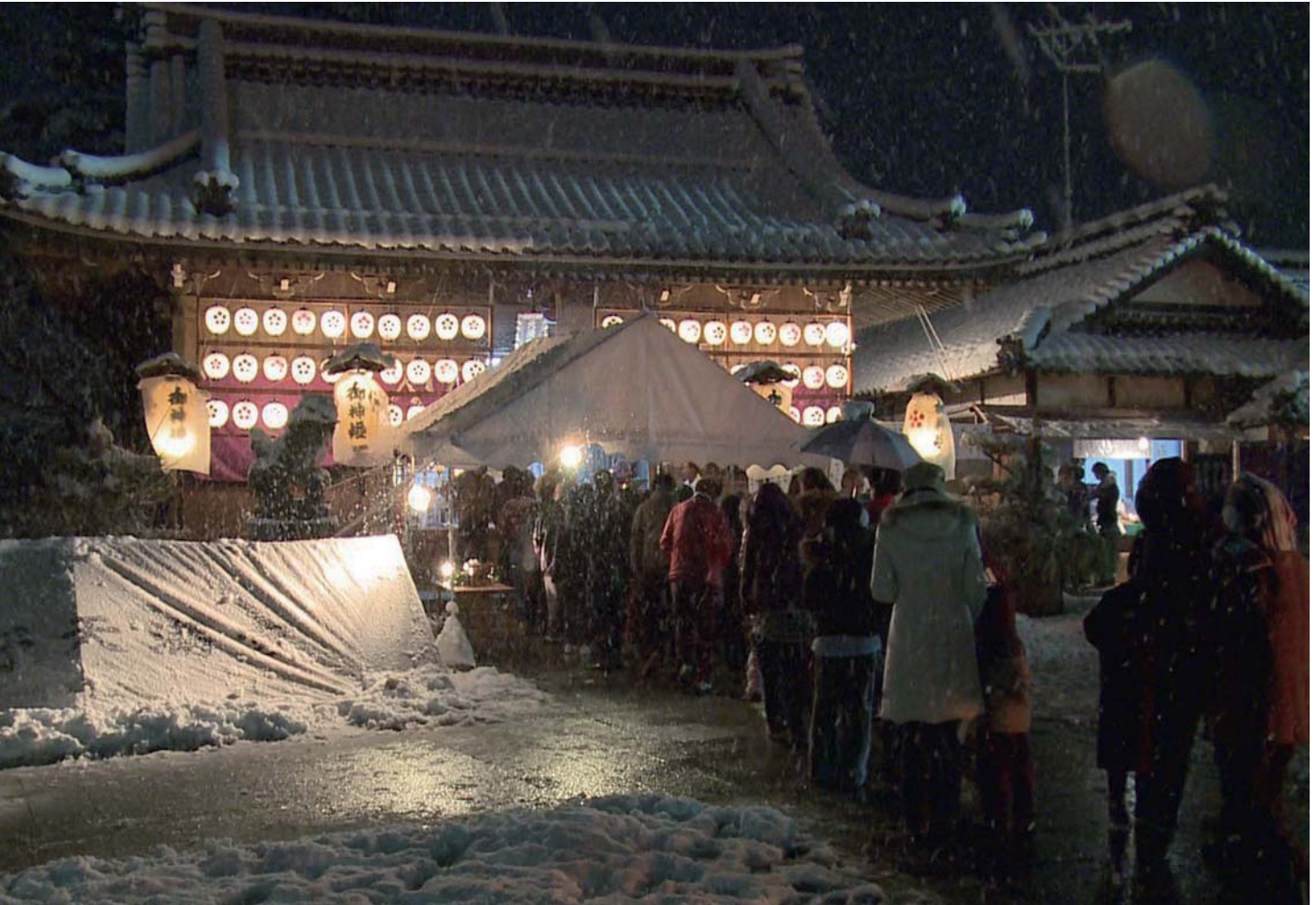
元日午前0時の初詣で賑わう 池野天満宮