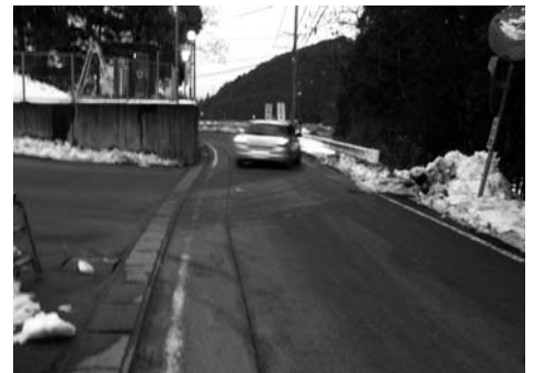
池田温泉本館出入口付近