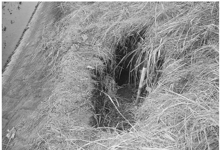
ヌートリアによる河川堤防の穴