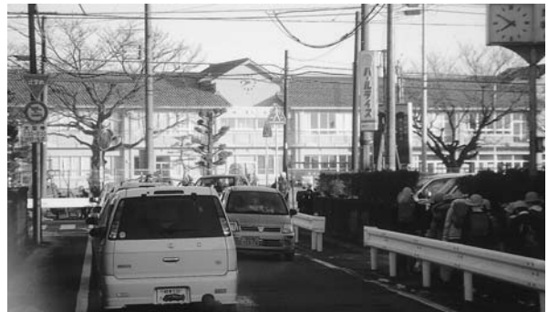
登校時のラッシュアワー