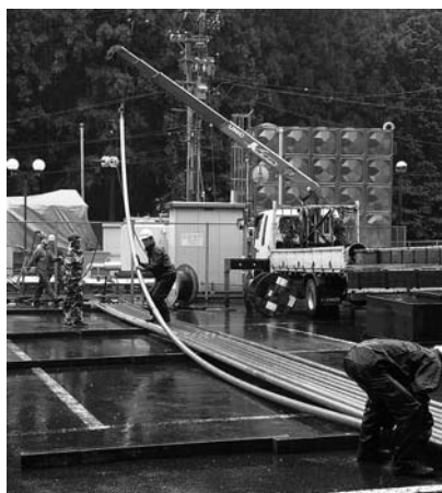
ポンプ入替工事（2年前） 長さ9.1mのパイプ33本の先に水中モーターが接続されています。