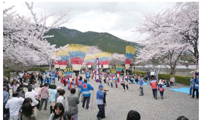
第60回池田サクラまつり(大津谷)