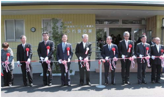
ふれ愛の家 竣工式・テープカット