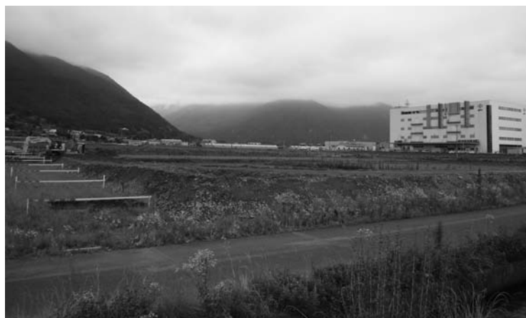
北部工業団地の現場