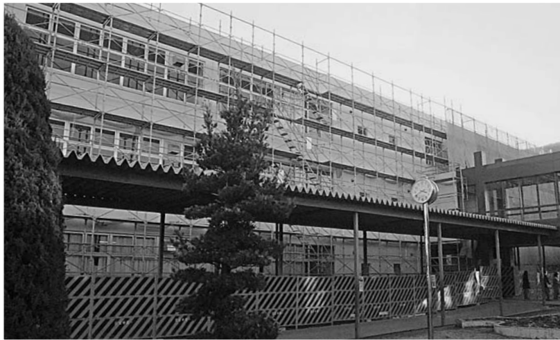
池田中学校南舎耐震補強工事

を受け現地調査をした。原因はトタン屋根からの雨漏りで、天井板に雨水が浸透して、落下したと考えられる。根本的に屋根材の補修、防水塗装の必要が考えられるので、23年度に予算計上したい。幸いケガ人はなかった。