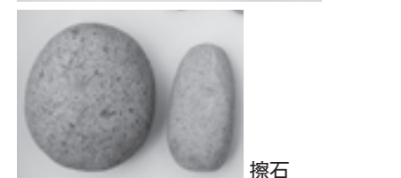
芝桜植栽予定地(藤代鎌ヶ谷)で出土