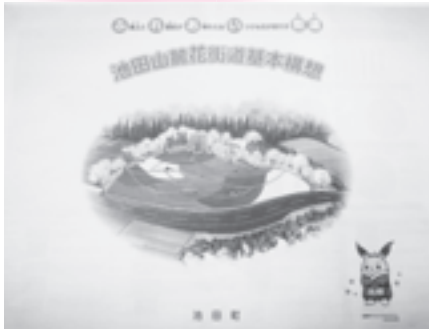
池田山麓花街道基本構想 霞間ヶ溪の芝桜イメージ

て自動車が素通りでは困る。景色を眺めながらゆくりり楽しんでいただきたい。道の駅入口との食い違いは解消したい。願成寺と藤代地内でカーブの改良を実施する。