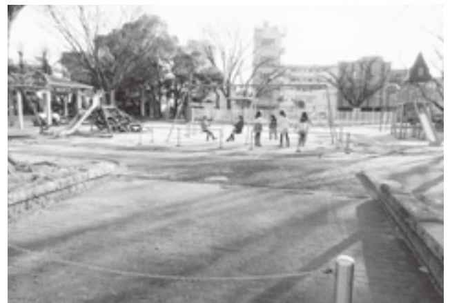
岐阜市ハツ梅公園に設置されて好評の遊具(高齢者用健康遊具)