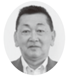
渡辺 幸一 議員

将来の高齢化社会を見据え、身近な公園などに健康エリアがあれば、日々楽しく健康管理ができ、健康寿命を延ばし町民の健康づくりを推進することにより、医療、介護費用の抑制のほか、地域コミュニティにもつながることが期待できる。既存の公園に高齢者用健康遊具を設置し幼児から老人まで利用できる(仮称)幼老公園に整備すべきと考えるが。