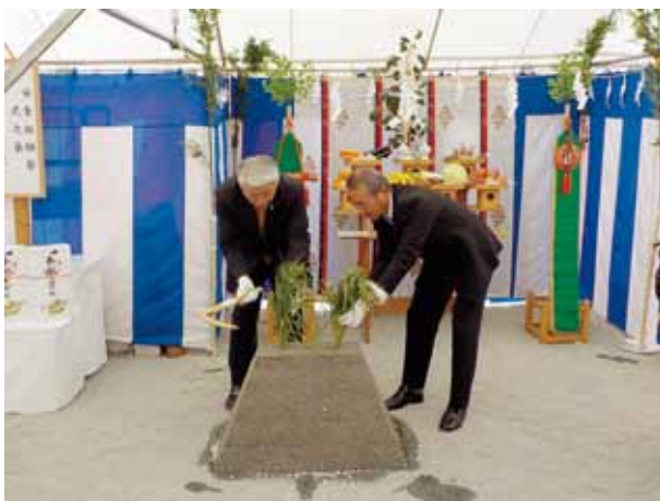
▶(刈初の儀) 刈初の儀を行う池田町長と大野町長