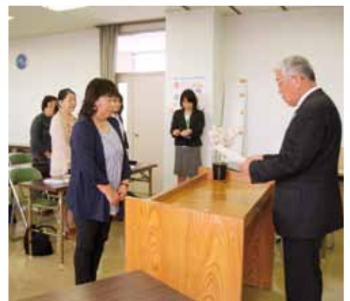
▲委嘱状を受け取る母子保健推進員

新学校給食センターは、鉄骨造一部2階建て、延べ床面積は約3,242.19㎡。調理能力は6,000食で、会議室や見学者用ホールも設けられます。完成は平成29年3月、給食提供開始は同年9月を予定しております。