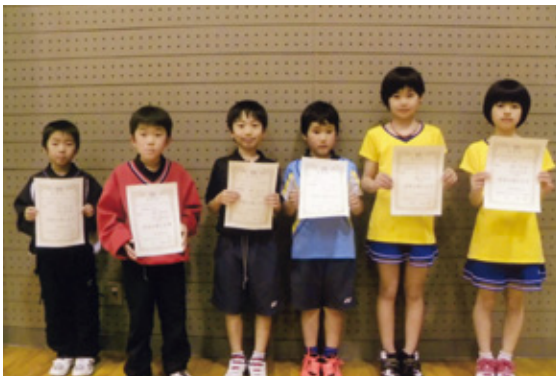
▲これからも頑張ります

岐阜県下29クラブから、214組が参加した大会で日頃の練習の成果を発揮し、入賞できました。