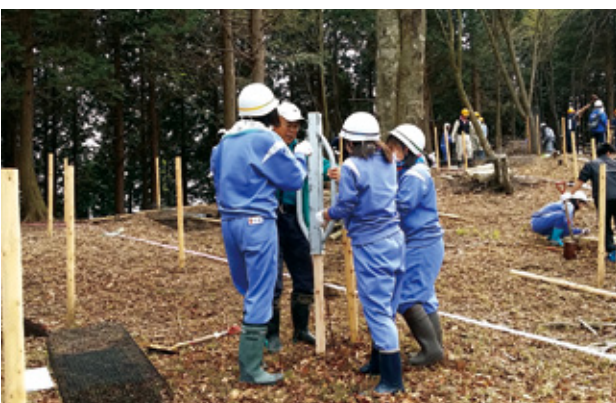
▶気持ちよく植栽ができました。