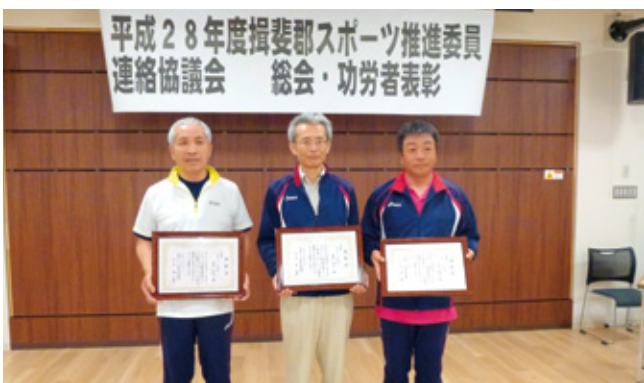
▲おめでとうございます