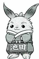
池田町マスコットキャラクター ちやちやまる