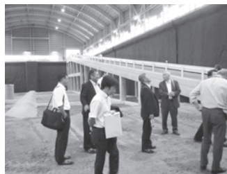
溶融飛灰の上で説明を受ける。

ガス化高温溶融炉では、可燃ごみを燃やすのではなく、高温で有機物を分解(ガス化)し、金属・セトモノ等は溶融物として取り出され、再資源化がはかられます。