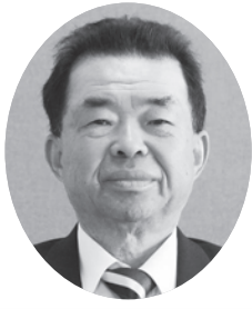
久保田 美洋 議員