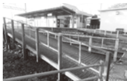
急すぎるスロープ（池野駅）

町長 スロープを1/12の勾配にするのは困難。手摺りをつけて安全に上げられるよう改善したい。