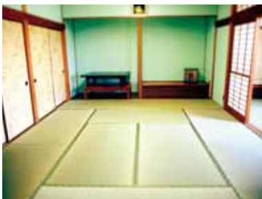
▲きれいになった和室