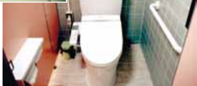
新しくなった 洋式トイレ▶