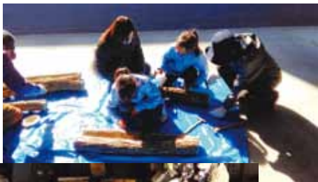
シイタケ収穫 楽しみ

2月4日(土) シイタケの菌打ち体験教室が中央公民館および役場にて開催され、町内の親子連れら約30人が挑戦しました。この教室は、森林の役割と恵みについて知ってもらおうと池田町が毎年開催しています。揖斐農林事務所林業課長が森林の状況やシイタケについて講演した後、揖斐郡森林組合の職員により菌打ちの指導を受けながら参加者は長さ約90cmのコナラにドリルで穴を開け、金づちで菌を打ち込みました。菌を打ち込んだ木は、参加者が持ち帰り、それぞれの家庭でシイタケを育てます。早ければ、今年の秋には収穫できるそうです。子どもたちは「早くシイタケ出るといいね」と楽しみにしていました。