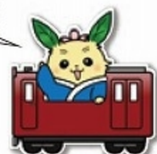
池田町マスコットキャラクター ちやちやまる