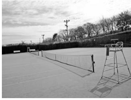
霞間ヶ深スポーツ公園のテニスコート

答 当該対象者に減免した場合、町民や一般選手の使用に支障が生じるため困難である。