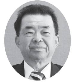
久保田 美洋 議員