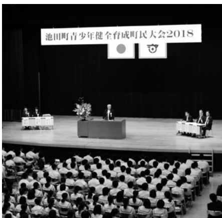
▲昨年の町民大会より