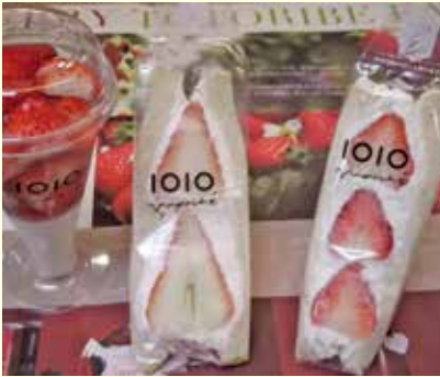
▲フルーツサンドイッチ

大野町の果物栽培農家さんによる出店で、自社農園で丹精こめて育てた苺、桃、マスカットを使つての「フルーツサンドイッチ」、「パフェ」、「かき氷」、「特製フルーツドリンク」などを提供する可愛さ◎、美味しさ◎のお店です。お一人でも、ご家族でも、女子会でも、ぜひ、覗いてみてください。