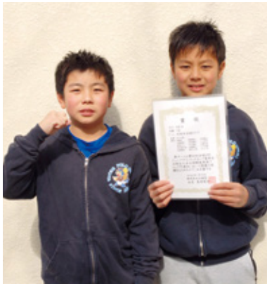
▲全国大会もメダル獲得目指して頑張ります！