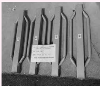
▲寄付を受けた杭打ち機

「なごやの水源・木曾三川流域連携事業寄附金」により杭打ち機を名古屋市上下水道局を通じて提供を受けました。今後の植栽活動などに役立てていきます。ご寄付をいただき、ありがとうございます。