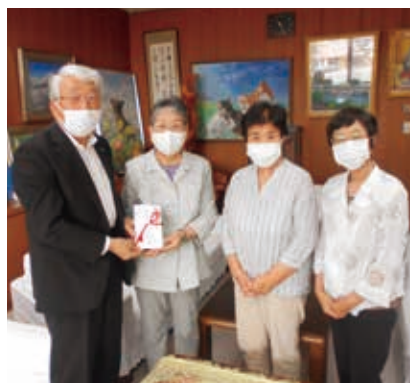
▲母子寡婦福祉連合会のみなさん

7月3日(金)、池田町母子寡婦福祉連合会様より、200,000円を小中学校の学校図書購入にとご寄付いただきました。ありがとうございました。